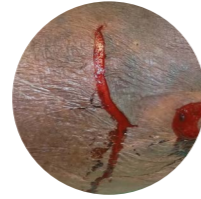
Type 1 Geen huidverlies