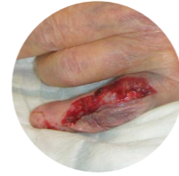
Type 2 Gedeeltelijk verlies van huidflap