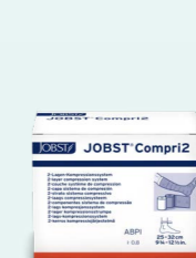
JOBST Compri2 Tweelaags compressie-zwachtelsysteem.

Voor veneuze ziektes en wonden op de onderbenen: