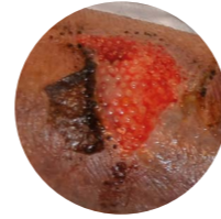
Type 3 Totaal verlies van huidflap