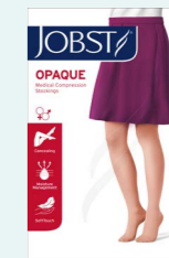
JOBST Opaque 15-20 mmHg

Dit product is meestal te verkrijgen via de bandagist.