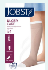
JOBST UlcerCare Tweelaagse verbandkous met liner.