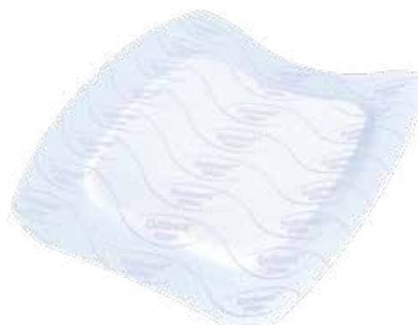
Cutimed® Siltec® B